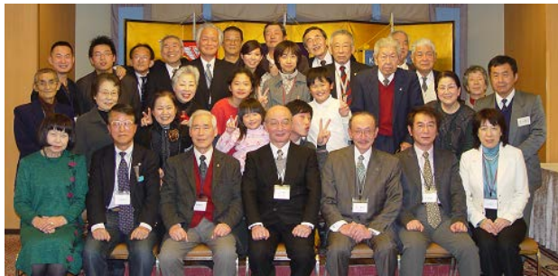
(合同クリスマス特別例会)